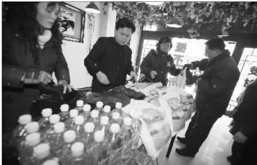
居民们正在领快报送出的年货

“活了这么大岁数,还没吃过牛蛙,这牛蛙怎么吃啊?”在年货发放现场,居民们已经讨论起来了。