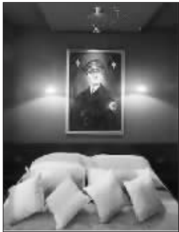
最阴暗的希特勒房