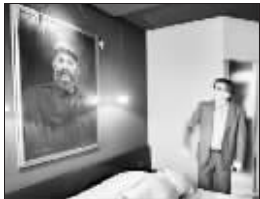
最小的卡斯特罗房