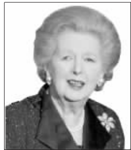
最爆棚的是撒切尔夫人房

扎布诺维克说:“克罗地亚人最喜爱‘铁托房间’,到目前为止,我们收到唯一的抱怨就是,肖像中的铁托没有穿上他那标志性的白色西装。”据《信息时报》报道