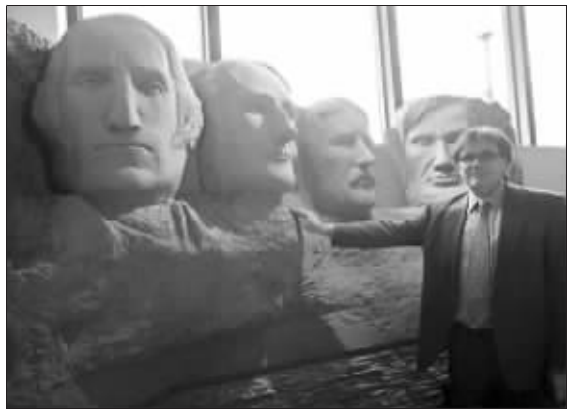
老板把美国国家纪念公园的四位总统巨像复制到了酒店