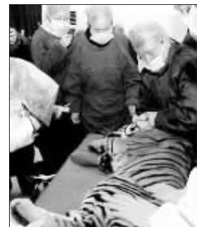
医生在为华南虎做手术

南昌动物园东门旁边的一个房间内,一只小华南虎静静地躺在铁笼子里,双目炯炯有神。3日下午,从南昌动物园传出喜讯,该院饲养的小华南虎日前成功实施白内障摘除手术。此举在全球尚属首例,也是小华南虎本月8日周岁生日的一份重礼。