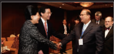
TESIRO 通灵董事主席考西柯会商商务部副部长马秀红