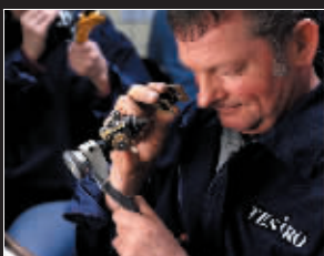
TESIRO 通灵的顶级钻石切割师