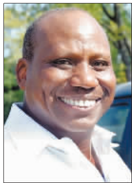
枪手查尔斯·李·桑顿