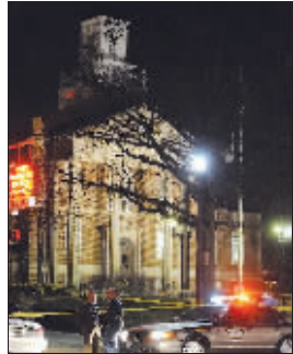
警察站在市政厅外

美国当地时间7日发生两起恶性枪击案,7日早些时候,洛杉矶市的文尼特卡区发生了一起枪击案,造成至少5人死亡;7日晚上,密苏里州柯克伍德市又发生了一起枪击事件,一持枪男子冲进市政大厅打死5人、打伤数人,行凶者被警察当场击毙。这两起枪击事件共造成至少11人死亡。