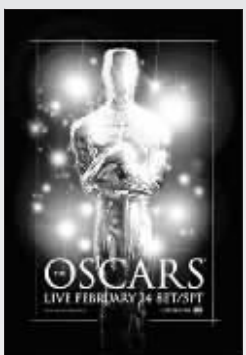
奥斯卡颁奖礼躲过一劫,图为官方海报