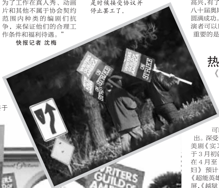
罢工了三个多月,终于可以收起示威牌复工了