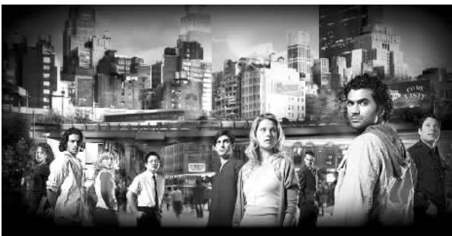
新一季《超能英雄》将在秋天与观众见面

昨日记者获悉,为期3个多月的美国编剧大罢工已经结束。美国编剧协会成员于当地时间2月12日分别在比佛利山和纽约开会表决,绝大多数编剧赞成复工。编剧们已于美国当地时间2月13日开始复工。深受观众欢迎的《超能英雄》《越狱》《24小时》《绝望主妇》等剧将陆续重登荧屏,奥斯卡颁奖礼躲过一劫,将如期举行。