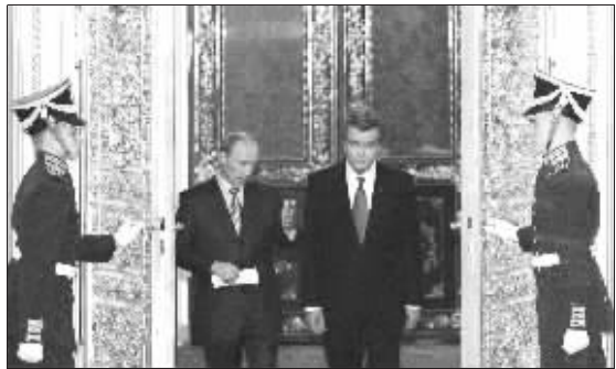
12日,普京(左二)在莫斯科与尤先科会晤

俄罗斯总统普京12日警告说,如果乌克兰加入北大西洋公约组织,俄可能将战略核弹对准乌克兰。