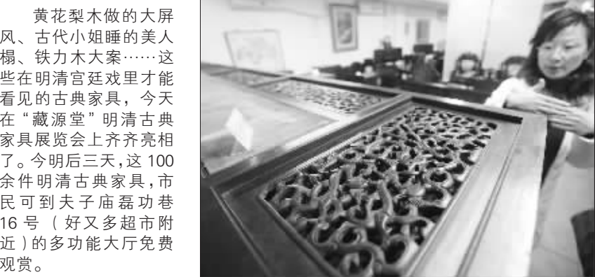
黄花梨木屏风只能叠着存放

黄花梨木做的大屏风、古代小姐睡的美人榻、铁力木大案……这些在明清官廷戏里才能看见的古典家具,今天在“藏源堂”明清古典家具展覧会上齐齐亮相了。今后三天,这100余件明清古典家具,市民可到夫子庙嘉功巷16号(好又多超市附近)的多功能大厅免费观赏。