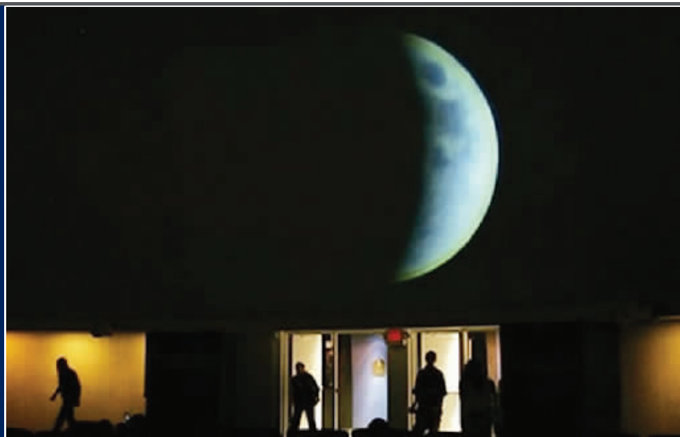
美国迈阿密科学博物馆