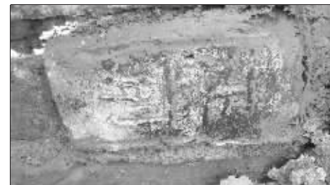
刻有“正前”的城墙砖