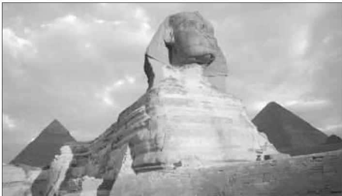
古埃及及狮身人面像