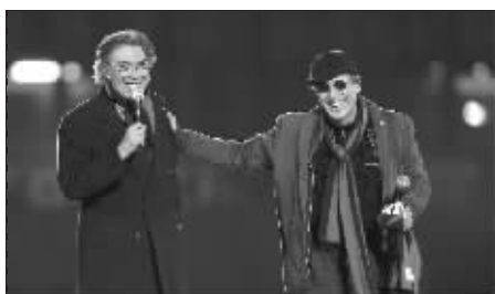
国米主席莫拉蒂(左)在庆典仪式上

落后的雷吉纳队似乎并不愿成人之美,随即发动了如潮的攻势,多次形成了对国米球门的直接威胁,然而发挥出120%能量的塞萨尔是无所不能的,无论雷吉纳球员的射门有多么刁钻,巴西人总是能够成功扑救。塞萨尔的出色表演也激励了其他队友,第34分钟,布尔多索将希门尼斯开出的任意球顶入球网,为国米锁定胜局。从这一刻开始,梅阿查球场内的歌声就再也没有断过。