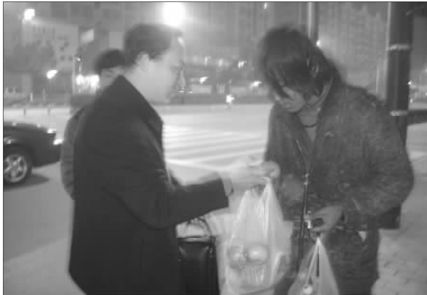
小伙不要失主的酬金,只收下食物

年十分瘦弱,蓬蓬的长发粘成一缕一缕,搭在脸前,遮盖住半张略显消瘦的面庞,上衣和裤子已经脏得看不出原来的颜色,撕烂的口袋旁,棉花暴露在外。