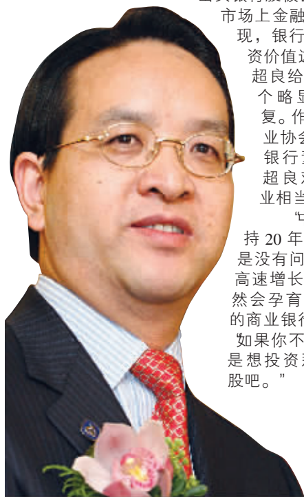
交通银行董事长蒋超良

“我经常跟我太太讲,你买银行股是不错的。”昨日,针对有记者提出买银行股被套,以及当前市场上金融股的低迷表现,银行股是否有投资价值这一问题,蒋超良给出了这样一个略显俏皮的答复。作为中国银行业协会会长、交通银行董事长的蒋超良对中国银行业相当有信心。 “中国经济保持20年的高速增长是没有问题的,一个高速增长的经济体必然会孕育一大批优秀的商业银行。”所以,“如果你不是想投机而是想投资那就买银行股吧。”