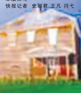
本版采访 快报记者 史丽君 王凡 闫弋