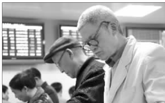
南京瑞金路一家营业部内,股民极度失望。