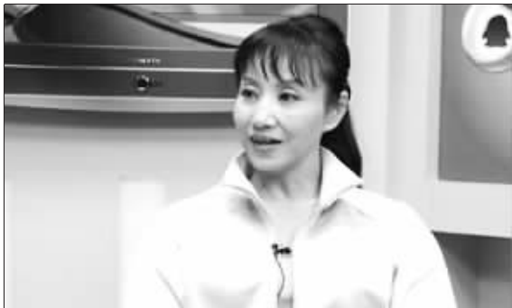
于芬外表柔弱,实则强悍

中国跳水队前副总教练于芬和国家游泳运动管理中心以及中国跳水队领队周继红的矛盾还在继续。继于芬通过博客揭露游泳中心和领队周继红克扣她的奖金后,游泳中心迅速以书面形式作出回应。