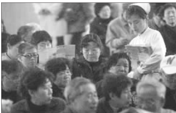
省中医院大礼堂座无虚席

药食针浴,多途并举 透析前期,即血肌酐在700μmol/L以下的肾衰,国内外肾病界尚无良策,目前治疗主要依靠中医药,及早中医综合治疗,能有效地延缓进入透析阶段的时间,部分病例能稳定几年甚至十几年。中药还能实现多途径用药,有机地将辨证方与静脉滴注、中药保留灌肠,有效的中成药保肾片、针刺等结合使用,各有针对性,相互协同,标本兼顾,对于延缓肾衰进展的近期效果和长期疗效都明显优于单一治法。