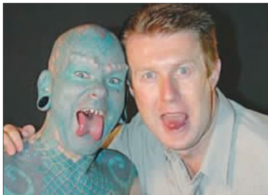
“蜥蜴人”(左)和记者合影