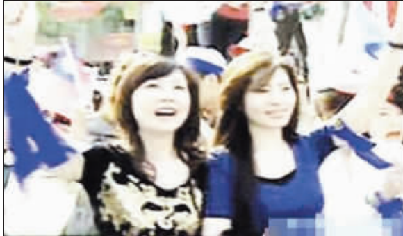
特种行业小姐高雄挺马

英九绿卡失效与否说不清楚;而陈水扁也撂下狠话,只要马英九证明绿卡失效他会立刻辞职。扁、谢两人一个以辞职、一个以退选猛攻马英九绿卡议题。