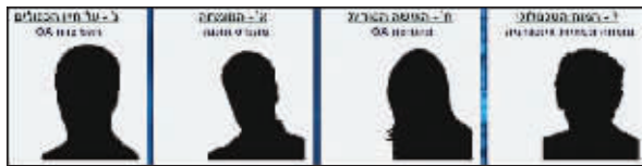
4名资深特工在互联网上开设博客

真实的特工生活究竟是什么样子?像电影《真实的谎言》中,即便是对妻子也要隐瞒身份?像“007”一样终日与危险周旋,有美女做伴?都不是。以色列情报局“辛贝特”日前委派4名资深成员在互联网上开设博客,通过他们的“现身说法”,卸下了笼罩在他们身上的神秘光环。“辛贝特”希望通过此举能吸引更多高科技人才加盟。