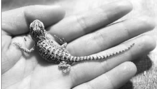
小松狮蜥只有手指般大