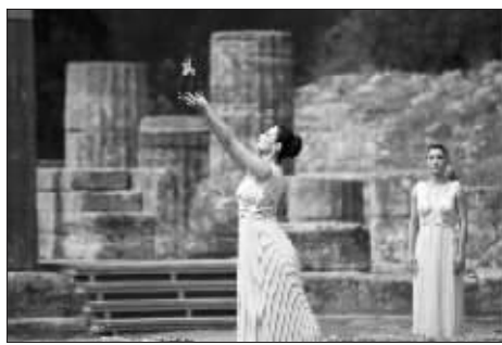
娜芙普利都(左)高高举起火种罐