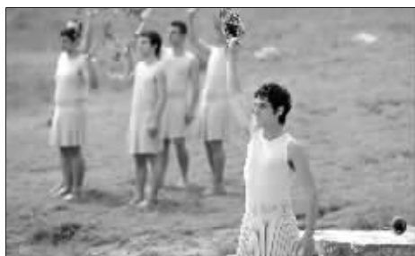
扮演男祭司的演员们在彩排中表演