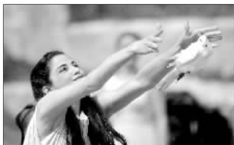
女祭司在彩排仪式上放飞鸽子