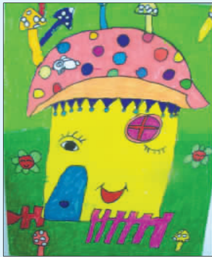
我的蘑菇房 无锡 华冠群

就可以自助打印美食优惠券。一餐至少能省20-50元。 上周末,给准丈母娘过生日。我从一大堆美食优惠券中挑了张火锅店的。这家店实惠又好吃,他们一家人都很喜欢。大家欢欢喜喜在店里大吃了顿。回家路上,准丈母娘还是心疼钱,偷偷“责备”我花了不少钱吧。我连忙掏出一叠优惠券说,吃饭可以打折。准丈母娘眼睛一亮,大声跟小曼说:“曼啊,还是小张会过日子,好好学学!”我嘿嘿一笑,看来跟小曼家的关系更稳咯。有了这张解决我双向费用问题的客户卡,还真是万事足矣。 (苏州 夏启民)