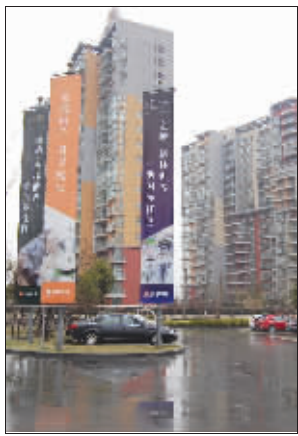
上海大盘格林世界

金地的开发特色是什么?它空降南京会给南京本土地产企业带来哪些冲击?3月17日-21日,《金楼市》在上海和深圳两地,近距离接触了这个让南京楼市既熟悉又陌生的大腕级房产企业。