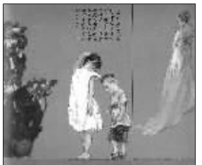
戛纳红地毯上的一幕