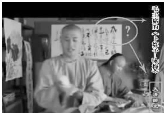
网友在视频截图上标出了穿帮之处

近日，一位昵称“不挂”的网友在网上爆料称，自己在26日收看央视4套中文国际播放的古装电视剧《大清御史》时，发现了荒唐的一幕。“昨晚无意中看到央视4套中文国际播放的《大清御史》，在钱津的家里，我看到墙上竟然悬挂着‘风雨送春归 / 飞雪迎春到 / 已是