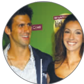
德约科维奇很有女人缘