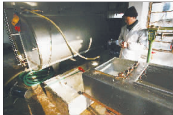
奶站的工作人员在检测原奶

目前原奶充足,奶厂压价,奶站的收购价是3元/公斤,卖出价依然是3元/公斤。加上人工及设施等费用,奶站目前严重亏本。