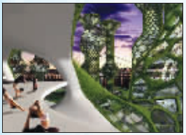
居民有充分的休闲场所

韩国首都首尔市正打算建造一座史无前例的“摩天蜂巢城”——它占地40万平方米,由15幢16到53层不等的塔楼组成,其形状酷似一个个硕大无朋的巨型蜂巢,并被绿色植物覆盖,看上去就仿佛是某种怪异的外星生物一般!而塔楼内部将隆起数个“圆球”,用于建造公寓、剧院、医院。据称,“摩天蜂巢城”将创造一个更适合未来人类居住的环境,目前它仍处于构想阶段,并有望在2026年建成。