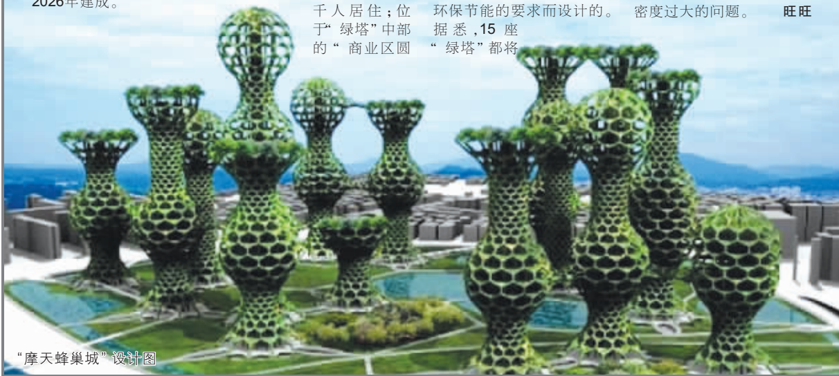
“摩天蜂巢城”设计图