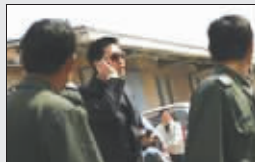
周杰打电话给朋友求助