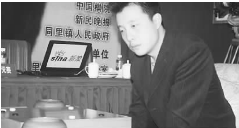
古力的眼神中充满杀气

第22届“同里杯”中国天元赛三番棋决赛昨天在江苏同里结束决胜局较量,古力执白236手中盘战胜前队友周鹤洋,以2:1的总比分再度加冕天元赛冠军,也达成天元赛史无前例的六连霸。在接下来的中韩天元对抗赛中,古力将遭遇韩国棋手元晟溱的挑战。