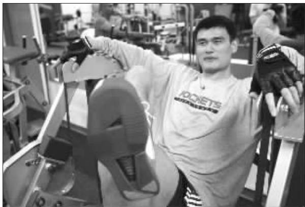
姚明接受康复训练

等待了五天后,姚明终于进行了这次回国日程上最重要的一件事情:接受由篮管中心组织的国内5位权威中医学专家的会诊,并进行初步的中医治疗。根据篮管中心的说法,专家一致认为姚明的恢复情况比预想的好。