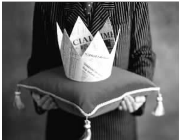
超级阶层在全球化时代拥有巨大的能量

属于超级阶层的人拥有比地球上其他阶层大得多的权力,他们中任何一个人的行为都能影响到其他几百万人的生活。他们不仅出现在金融和商业领域,还出现在政治、艺术、非营利事业和其他领域。属于这个阶层的人极少,也许有6000、7000或8000人。 最新一期美国《新闻周刊》封面故事揭示了这一阶层在一个全球化时代拥有的巨大能量。