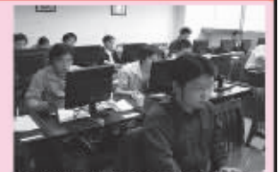
第45期学员结业前已被瓜分一空,现从华为、用友等返校参加毕业考