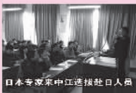
日本专家来中江选拔社日人员