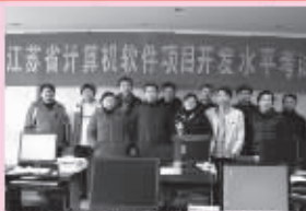
第43期学员全部就业,分别进入国电南自、国电能源、三宝等公司