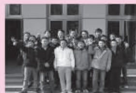
今年3月3日刚结业的第50、51期40名学员已被联想等公司录用,他们一入职就能融入团队独立工作,显示出中江学员能力强后劲足