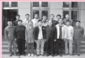
第44期14名学员全部就业,其中13名进入中软海纳及中兴软件