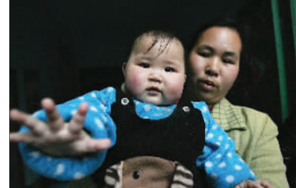
小女婴半年没睡过觉

重庆璧山人殷某从2001年至今,从未睡过一次觉,39岁的他戏称自己提前“不惑”;6年多来,他的大脑始终处于清醒状态。北京大学第三医院副院长、神经内科主任樊东升说,殷某的这种情况可能是一种主观性失眠。也就是说,从生理角度来说,殷某已达到了睡眠的效果。 据《东方今报》