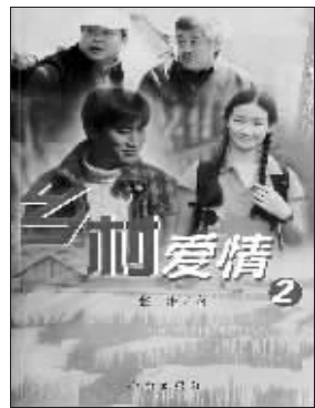
张继 著 作家出版社友情推荐