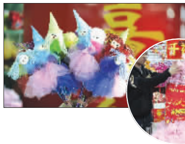
本期店铺:千禧喜铺 店铺地址: 苏宁商品批发市场1楼G区5号