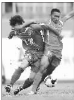
双方球员拼抢激烈

上半场打得十分激烈,双方都有破门机会。直到第 44 分钟,有有获得任意球机会,17 号崔光浩把球传到禁区,36 号谢里奥顺势一脚垫射,皮球越过门将钻进死角。这是南京有有本赛季的第一个进球,也让有有迎来了赛季的第一个主场胜利。