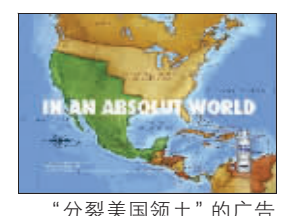
“分裂美国领土”的广告在墨西哥人眼中当然“绝对完美”,但不少对主权敏感的美国人,看到这广告后都大为光火,感到受辱,纷纷在网上留言指责酒厂“煽风点火”挑拨敏感的政治神经,又称酒厂

最近,不少美国人被瑞典一家酒商“分裂美国领土”的广告惹得怒气冲天,起因是商标为“绝对伏特加”(Absolut Vodka)的瑞典酒商,为吸引墨西哥消费者,日前推出了一个以1848年美墨战争前两国边界地图作背景的广告,将当年被美国巧取豪夺的加州、得州、亚利桑纳州及新墨西哥州通通“归还”给墨西哥。据报道,这张北美地图广告,是“绝对伏特加”酒商推出的一系列命名为“在绝对理想世界里”的一则广告。它