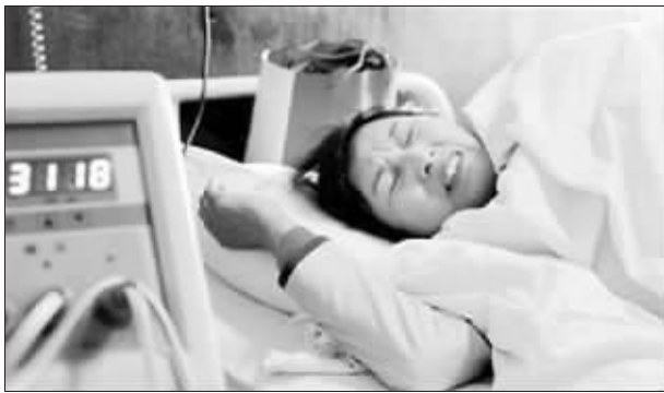
女子在医院接受治疗