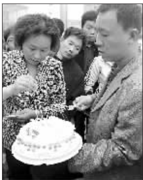
路人分享生日蛋糕

芦女士在广场上挂起了条幅,上面写着红色大字:“桐桐,你回来吧!”旁边用小字写着芦女士女儿桐桐的特征,还印有两张桐桐的图像。条幅前面的地上,铺着一张红纸,是芦女士写给女儿的一封信,旁边放着一个蛋糕。原来,芦女士将近半年没有见到女儿了。她在二七广场办这个特殊的生日聚会,是想呼唤女儿早点回来。