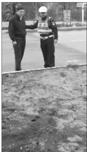
民警劝阻市民穿越马路

与施工人员一样苦恼的,还有交警五大队,面对那些不顾车流横穿马路的行人,两名民警来回穿梭制止,但是,横穿马路的人太多了,他们根本忙不过来。