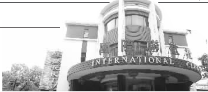
国际联欢社(南京饭店东门,中山路249号)