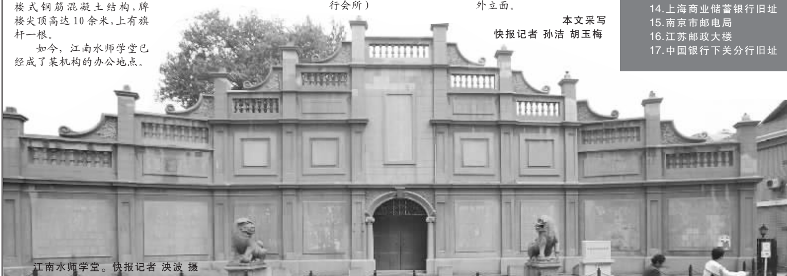
江南水师学堂。