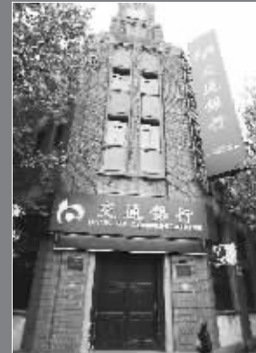
中国银行南京分行旧址。