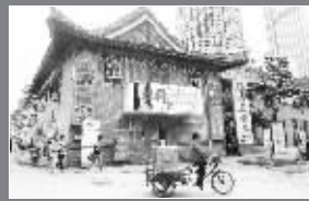
国民政府立法院、监察院(中山北路105号)