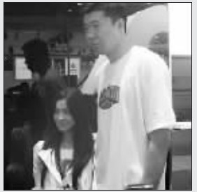
王治郅日前出现在2008年北京车展的现场,受到美女球迷的追捧。