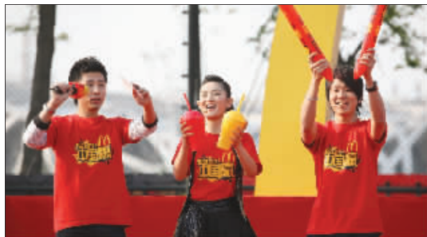
谢娜(中)、林俊杰(右)在庆典上

“我就喜欢中国赢”……前天下午,这样的呼喊声充斥了整个国家奥体中心,奥运会全球合作伙伴麦当劳公司正在这里举行盛大的麦当劳助威团奥运倒计时总动员庆典。在庆典上,伴着“我就喜欢中国赢”的祝福声,1000多位参与了麦当劳奥运助威团全国招募计划的奥运会支持者还向世界吉尼斯纪录史上的拉拉队助威舞蹈人数之最发起了挑战。