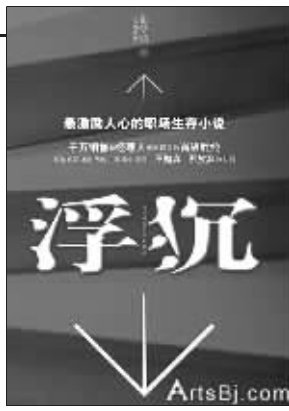
崔蔓莉 著 陕西师范大学出版社

书之感。除了销售部门,本书又涉及到了市场部、技术部等其他部门的工作经验与方法,总以让每一个职场中人能够重新了解职场、审视自身的问题与环境,除了赛思、SK,它涉及到的瑞恩、鑫鑫等中小企业也都让人颇有感触,而我最喜欢的,除了书中讲述的由晶通电子七个亿技术改造引发的销售战争,就是晶通电子因为企业改制引发的矛盾与冲突,它从一个侧面叙述了国企改革方方面面的方方面面,不仅展现了另一种企业模式与管理理念,更全面反映了当下社会的各