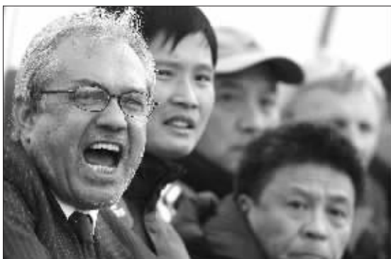
欧洲拉练,从杜伊的表情来看,他并不满意 资料图片

4月的贝尔格莱德春光明媚,但是杜伊的思绪已经飞到了炎热的6月和8月。在那时,他将成为13亿中国人目光的焦点,他将决定中国足球未来的命运。而那也将是他职业生涯中的最后一首歌。在那之后呢?他将离开中国,不再担任中国国家队主帅,即使国家队已经从世界杯预选赛小组赛出线,也不能让他留下来。这是杜伊让全中国人震惊的一个决定。