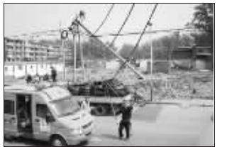
两名拾荒者将带有一万伏高压的线杆刨倒