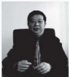
南京家裝行業資深專家 南木大大裝飾總經理

家裝行業中的轉包現象是裝飾公司在接到業務后,在提取高價管理費后将業務及工人工頭或工程隊,這種操作模式雖然減小了裝飾公司的管理難度,但因為留下的利潤空間在除去人工費之外所剩無幾,而工頭想獲取更多的利潤勢必會偷工減料,做虛假不得人的勾當。裝飾公司出台再多的管理辦法也是防不勝防,給工程品質帶來無窮的隱患,裝修品質難以得到有效保證,許多信譽或信譽過高的消費者對之深惡痛絕。而很多業戶轉包經營方式的裝飾公司面對消費者的質詢,往往矢口否認,避而不談。