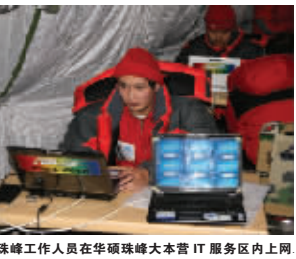
珠峰工作人员在华硕珠峰大本营IT服务区内上网

随即,中国登山队为完成2008年护送圣火登顶珠峰进行的实地演练,与此同时对华硕的电脑器材测试工作,也在紧张有序地同步开展。为期一个月的实际应用与测试表明,无论是在冰塔林冰川的测量过程中,还是在数千米的高压环境下,队员携带的所有机器依然能够稳定运行,毅力惊人。不久后的2007年5月24日凌晨,华硕U5笔记本电脑还跟随中国登山队队长王勇峰,创下了笔记本电脑全球首登珠峰峰顶的记录。 在距北京奥运会开幕不到90天的时刻,奥运圣火因为登上了一个前所未有的高度,而更值得所有中华儿女骄傲与铭记。即使有幸参与助力这一伟大壮举的"世界最高网吧"并不会为更多人熟知,即使全程见证这一历史时刻的华硕只是默默守候,它们仍将有一段不可复制的燃情记忆,与自己,与世人共勉。