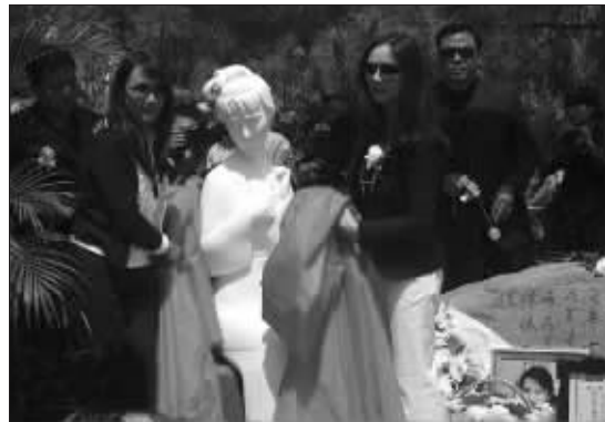
陈晓旭塑像勾起了人们的回忆

去年5月13日，42岁的“林妹妹”陈晓旭因乳腺癌不治离世。昨日是陈晓旭逝世一周年的日子，上午10时，陈晓旭骨灰安放仪式在北京天寿陵园举行。陈晓旭的家人、生前好友、87版《红楼梦》剧组人员以及媒体记者等200余人参加了仪式。