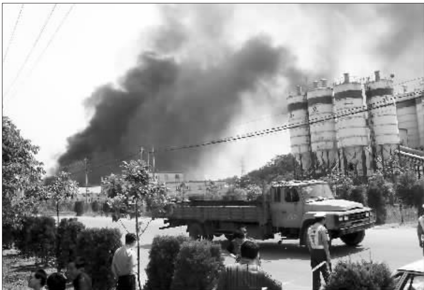
化工厂上空浓烟滚滚